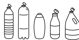
Bouteilles et flacons en plastique avec ou sans bouchon